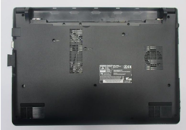
Abbildung 1 – SD-Cardreader-Dummy entfernen

Zuerst entfernen Sie bitte den SD-Cardreader-Dummy aus Ihrem exone® go Notebook, wie in Abbildung 1 aufgeführt: